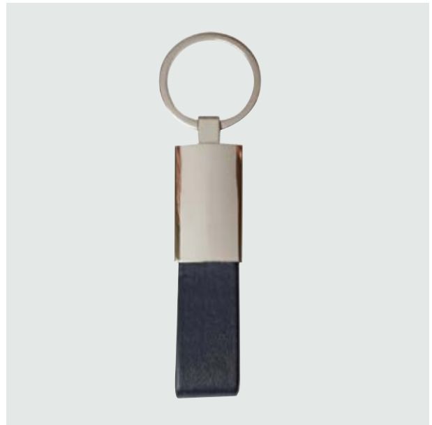
LLA 35 Llavero Rectangular Curpiel