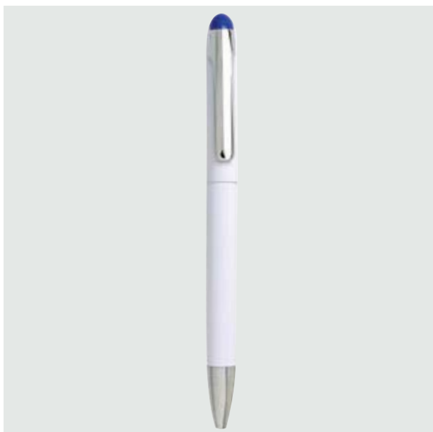
BOL 09 Bolígrafo Luke