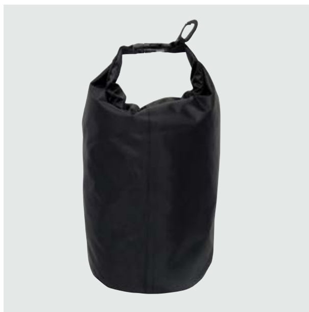
MAL 102 Dry-Bag Armstrong

Material: Polyester Medida: 35 x 27.5 cm