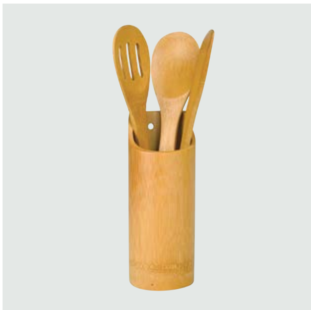
CAS 58 Spoon Set