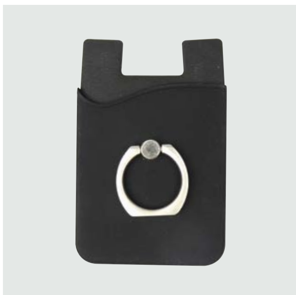
TEC 257 Mobile Tesla