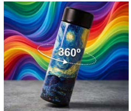
Full Color 360°

Consiste en transferir una pasta espesa de tinta a través de una malla tensada en un marco de madera o metálico. Esta técnica funciona solamente sobre superficies planas.