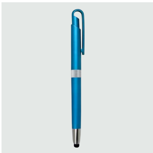
BOL 222 Bolígrafo Jasper