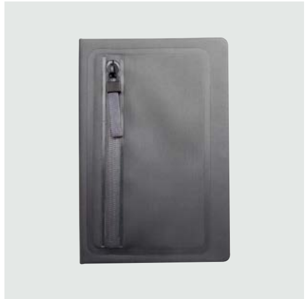
ESC 536 Libreta Denver