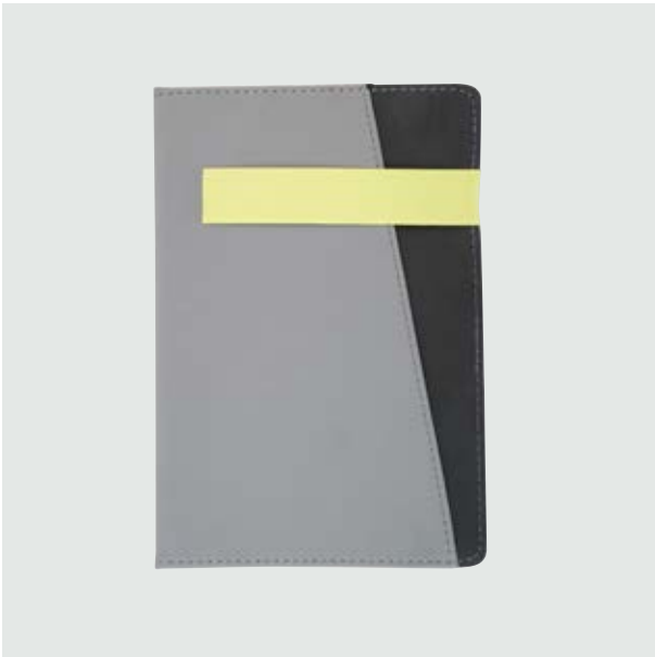
ESC 531 Libreta Moskú