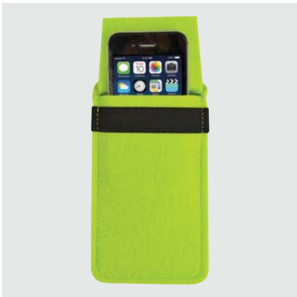
TEC 27 Phone-Case Volta