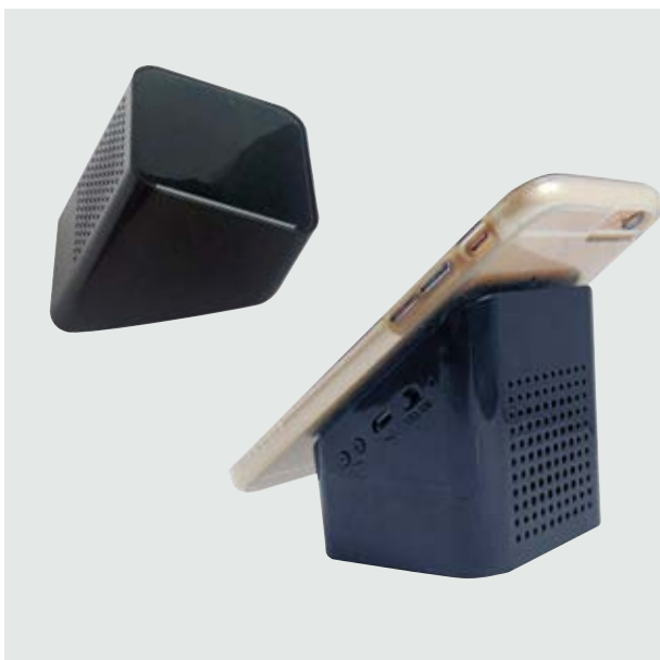
TEC 42 Bocina Dunlop