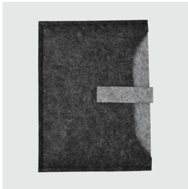
TEC 773 Mini Porta iPad Dalton