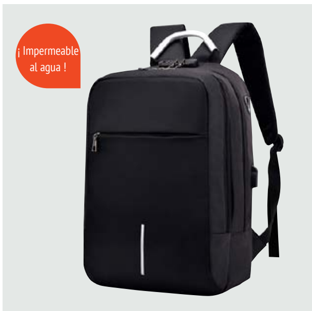
MAL 608 Backpack LeBron ■