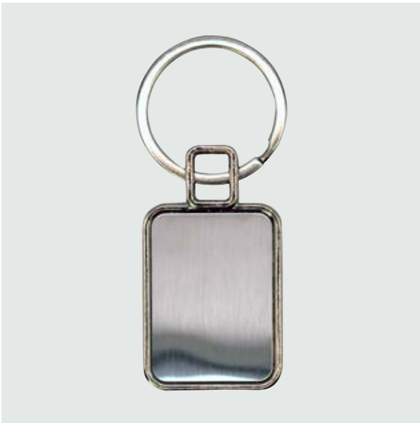
LLA 23 Llavero Cuadrado Plano