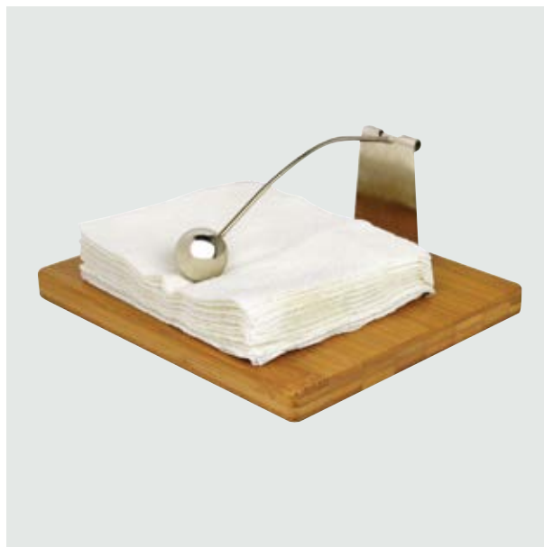
CAS 60 Servilletero Wiki