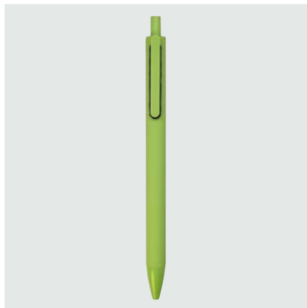
BOL 14 Bolígrafo Angélico