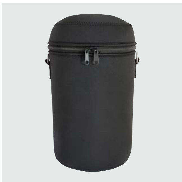
MAL 109 Lonchera Halep

Material: Neopreno Medida: 24 x 16 cm diámetro