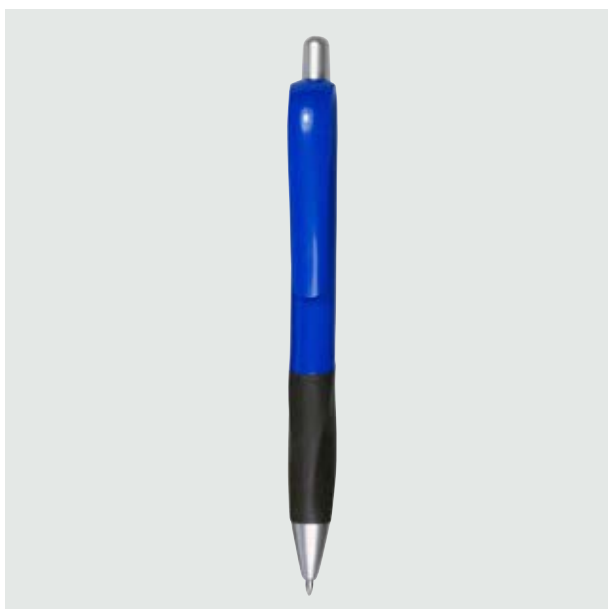
BOL 06 Bolígrafo Fiori