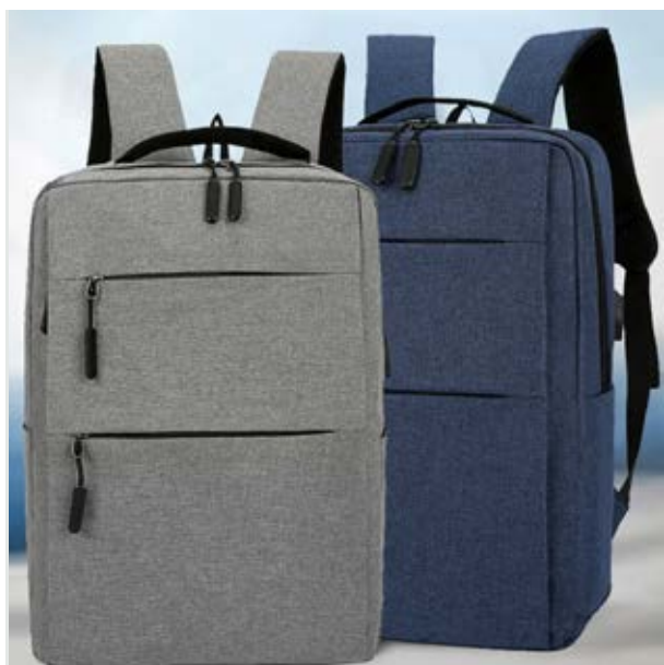
MAL 611 Backpack Duncan ■ ■