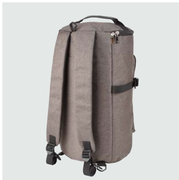
MAL 610 Backpack Harden ■