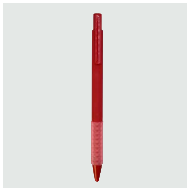
BOL 07 Bolígrafo Homer