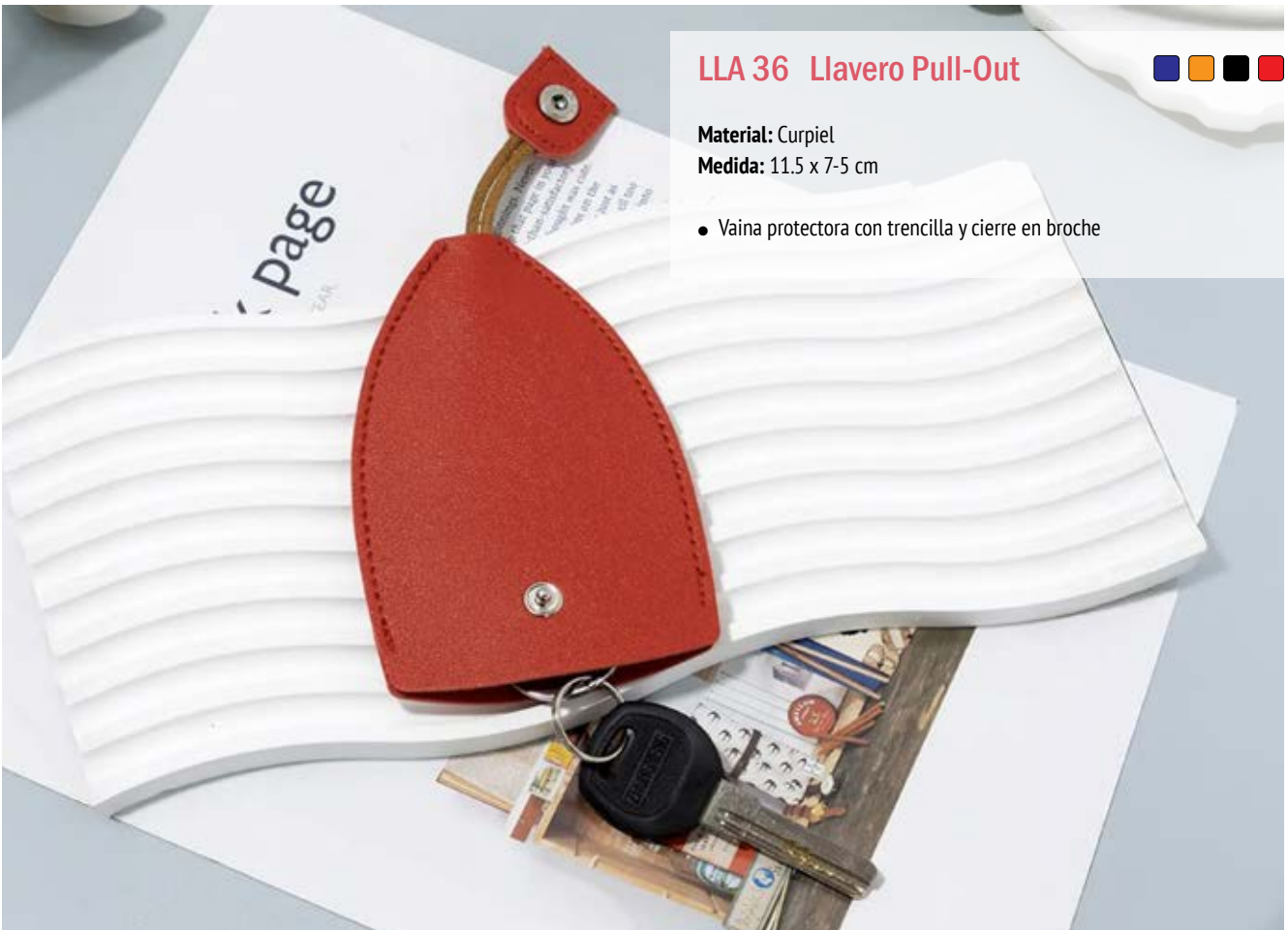
LLA 36 Llavero Pull-Out

Material: Metal y Curpiel Medida: 12.1 x 2.2 cm.