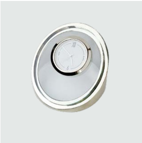
REJ 03 Reloj Tikal