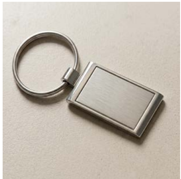
LLA 22 Llavero Rectangular Sencillo Plano