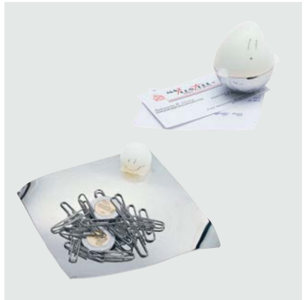
ESC 590 Set Fantasma